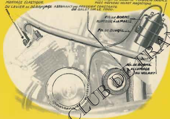
FIL DE BORNE RUMPEUX À LA MAIN