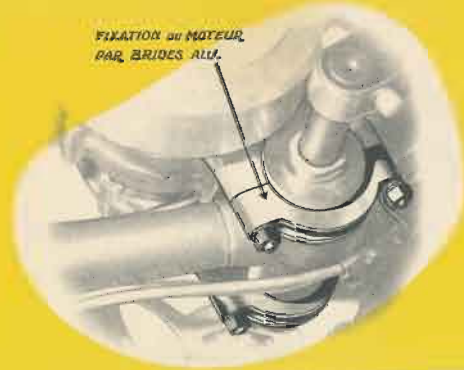
FIXATION DU MOTEUR PAR BRIDES ALU.