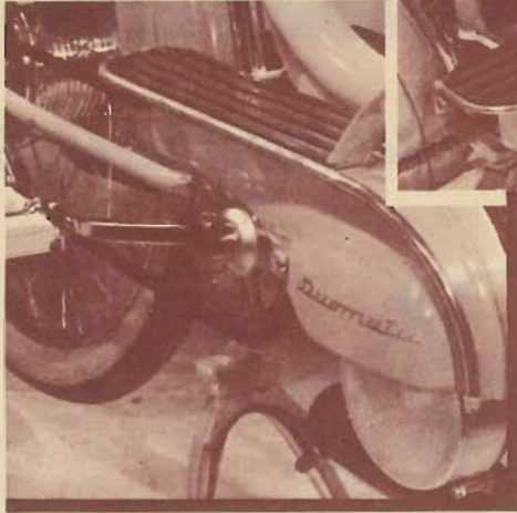
Repose-pieds caoutchoutés larges et confortables. Pare-jambes très efficaces.